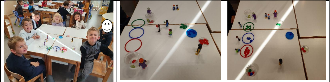
Les élèves de Mme Henry GS/CP Hasnon

Les Grandes Sections reviennent en détails sur la JNSS afin de développer le langage oral et écrit mais aussi la chronologie dans le temps des différentes actions de cette matinée. Après avoir réalisé la maquette des parcours, ils ont remis dans l'ordre, individuellement, les différentes photos et se sont exprimés sur les temps forts de cette matinée.